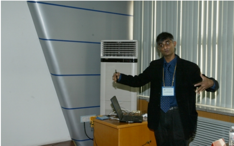
英国皇家科学院、工程院院士剑桥大学亨利·巴帝斯亚教授在作学术报告。