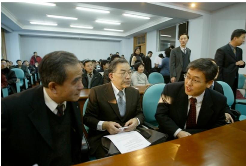
各国学者在会前交流。